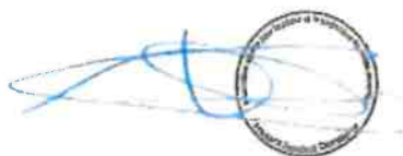
Fralsans Ranchot Dampierre

La fédération de pêche du Jura approuve cette charte et s'engage à en faire la promotion.