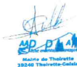
Pêche en Petite Montagne

AAPPMA LA GAULE DU BAS JURA 1, rue de Crissey - 39100 DOLE Président