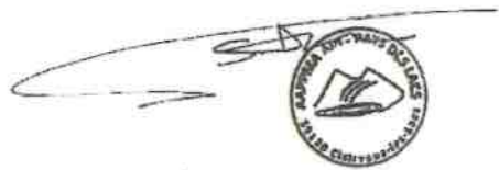
Ain-Pays des Lacs

Nous vous remercions de votre engagement à entretenir la bonne entente entre usagers de nos milieux aquatiques afin de faire perdurer puis développer les parcours de la pêche de la carpe de nuit.