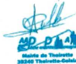
Pêche en Petite Montagne

AAPPMA LA GAULE DU BAS JURA 1, rue de Citecy - 39100 DOLE Président