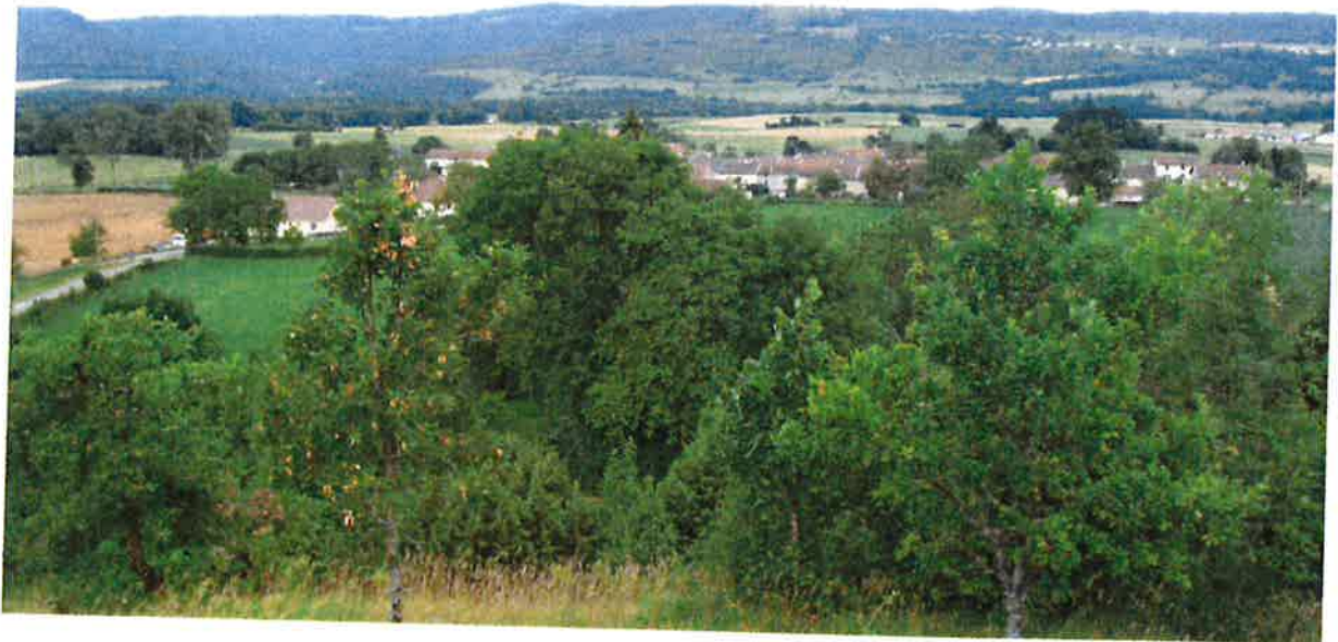
Le village vu depuis la chapelle

L'organisation future du village restera cohérente avec les différentes contraintes environnementales qui pèsent sur CHISSERIA :